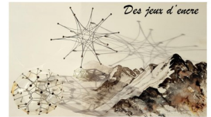
Aux sculptures polyédriques